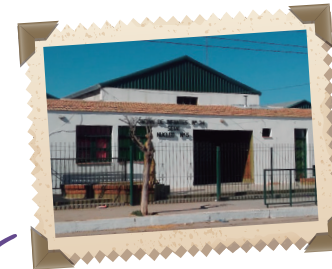
Jardín en Chepes, La Rioja, en honor a Rosario Vera Peñaloza

Rosario, quien en 1898 regresó a La Rioja, fundó el Jardín de Infantes anexo a la Escuela Normal dos años más tarde. Así es que éste, en 1900, se convirtió en el primero de la provincia y aún hoy lleva su nombre.